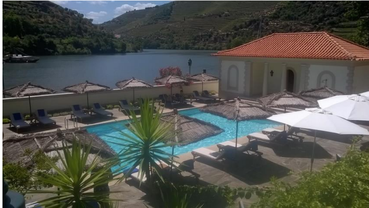
Blick vom Vintage House Hotel auf den Douro Fluss

Empfehlungen: Douro Prime Bücher Flor de Estrela Casa Amarela