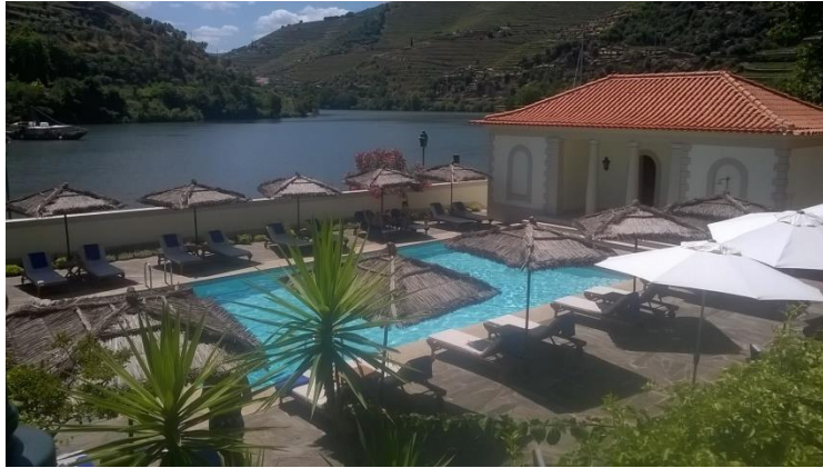
Vista do Hotel Vintage House no Rio Douro

Sugestões: Douro Prime Livros Flor de Estrela Casa Amarela